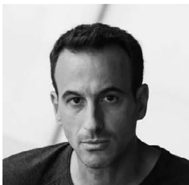
Hofesh Shechter Chorégraphe