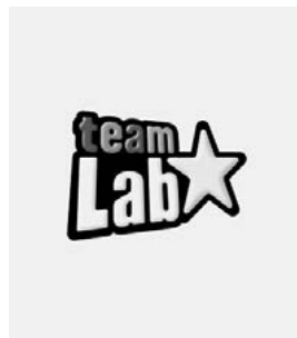
TEAMLAB Scénographie et art numérique