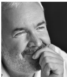
MARC MINKOWSKI Direction musicale

Nommé directeur général de l'Opéra national de Bordeaux en 2016, Marc Minkowski a fondé le festival Ré Majeure en 2011; il est aussi Conseiller artistique de l'Orchestre de Kanazawa (Japon). Il aborde très jeune la direction d'orchestre et prend une part active au renouveau baroque avant d'aborder le répertoire de Mozart, Rossini, Offenbach et Wagner. Régulièrement à l'affiche à Paris, il est aussi invité sur les grandes scènes internationales, de San Francisco à Moscou, en passant par Bruxelles et Salzbourg, aux côtés des orchestres les plus prestigieux. Ces dernières années, il collabore notamment avec des metteurs en scène tels que Laurent Pelly, Olivier Py ou Dmitri Tcherniakov. La saison passée, il dirige notamment Robert le diable de Meyerbeer à Bordeaux, Les Contes d'Hoffmann à Valence, la Trilogie Da Ponte à Barcelone et à Bordeaux, ainsi que Platée à Paris; il fait en outre son apparition sur la scène du Grand Théâtre pour le concert de la Saint-Sylvestre.