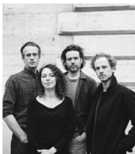
FC BERGMAN Mise en scène et décors