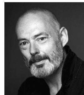
MARK PADMORE Ulysse / L'Humaine Fragilité Ténor