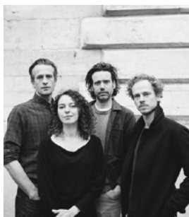
FC BERGMAN Mise en scène et décors