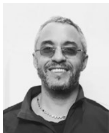
Amine Amharech Scénographie

Figure de proue de la scène contemporaine belge, fondateur de la Compagnie Eastman, Sidi Larbi Cherkaoui compte plus de 50 chorégraphies à son actif. Bien connu du public genevois, il a donné au GTG Loin en 2005 et 2008 et Fall en octobre 2019, dans le cadre de la soirée Minimal Maximal . En juillet 2022, il quitte la tête du Ballet Vlaanderen, avec lequel il a créé Fall (2015), Exhibition (2016) et Requiem (2017), pour prendre la direction du Ballet du Grand Théâtre. En 2013, il s'associe avec Damien Jalet et Marina Abramović pour Boléro à l'Opéra national de Paris puis avec les mêmes pour Pelléas et Mélisande à Anvers, en 2018. Ses mises en scène d'opéra comptent également Les Indes galantes de Rameau et Alceste de Gluck au Bayerische Staatsoper de Munich et Satyagraha de Glass pour Theater Basel. En 2023, il met en scène au GTG Idomeneo de Mozart dans une scénographie de Chiharu Shiota. collaborations interdisciplinaires avec des artistes visuels, des designers et des musiciens du monde entier.