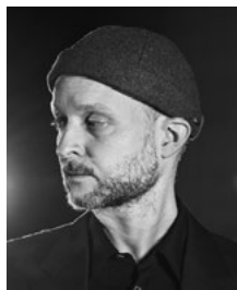
Sidi Larbi Cherkaoui Chorégraphie

Figure de proue de la scène contemporaine belge, fondateur de la Compagnie Eastman, Sidi Larbi Cherkaoui compte plus de 50 chorégraphies à son actif. Bien connu du public genevois, il a donné au GTG Loin en 2005 et 2008 et Fall en octobre 2019, dans le cadre de la soirée Minimal Maximal . En juillet 2022, il quitte la tête du Ballet Vlaanderen, avec lequel il a créé Fall (2015), Exhibition (2016) et Requiem (2017), pour prendre la direction du Ballet du Grand Théâtre. En 2013, il s'associe avec Damien Jalet et Marina Abramović pour Boléro à l'Opéra national de Paris puis avec les mêmes pour Pelléas et Mélisande à Anvers, en 2018. Ses mises en scène d'opéra comptent également Les Indes galantes de Rameau et Alceste de Gluck au Bayerische Staatsoper de Munich et Satyagraha de Glass pour Theater Basel. En 2023, il met en scène au GTG Idomeneo de Mozart dans une scénographie de Chiharu Shiota. collaborations interdisciplinaires avec des artistes visuels, des designers et des musiciens du monde entier.