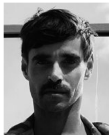
Wolfgang Menardi Décors

Née à Prague, elle a étudié le chant à Bâle et à Genève, puis la mise en scène d'opéra à l'Académie de théâtre de Bavière. Après La voix humaine et Romulus le Grand à Neuchâtel, elle a mis en scène L'Enfant et les Sortilèges à Bâle, Pelléas et Mélisande à Oslo et à Bâle, L'Orfeo et Dido and Aeneas à Bilbao ; La bella dormiente nel bosco à Lyon ; Der goldene Drache , Die kahle Sängerin , La traviata et Benvenuto Cellini à Dresde ; Dark Spring et Dark Fall , deux premières mondiales, à Hanovre ; Carmen , Eugène Onéguine et La Passion grecque , à Prague ; Rigoletto , Erwartung , Missa in tempore belli , au Theater an der Wien ; La Wally , au Staatsoper Berlin ; Giustino de Vivaldi et Thomas de K. F. Haas, Ernani à Anvers et Saint-Gall ; Der fliegende Holländer à Weimar. En 24/25, elle a mis en scène Peter Grimes à Amsterdam. Puis ont suivi Le Grand Macabre à Palerme, Die Zauberflöte à l'Opéra national de Vienne et Lear à Prague.