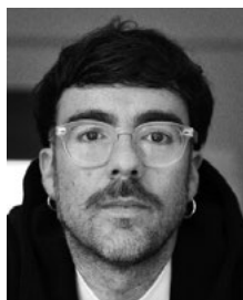
Marcos Morau Chorégraphie

Formé entre sa Valence natale, Barcelone et New York à la photographie, au mouvement et au théâtre, cet artiste protéiforme dirige depuis 2004 La Veronal, l'une des compagnies de danse les plus primées et les plus acclamées au niveau international en Europe, avec des spectacles au Théâtre national de Chaillot, à la Biennale de Venise, au Festival d'Avignon, à Tanz Im August à Berlin, au Sadler's Wells à Londres, parmi tant d'autres. Il est également artiste invité, conciliant la performance et la danse, avec le Ballet de l'Opéra de Lyon, les Grands Ballets Canadiens, le Ballet royal danois ou le Ballet royal de Flandre, pour n'en citer que quelques-uns. Depuis 2023, artiste associé au Staatsballet Berlin, chorégraphe résident au NDT et artiste invité à la Triennale di Milano. Il a été nommé chevalier de l'ordre des Arts et des Lettres en 2023 et sélectionné comme meilleur chorégraphe de l'année 2023 et 2025 par Tanz .