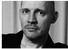
Stéphane Degout Bariton La Tempête