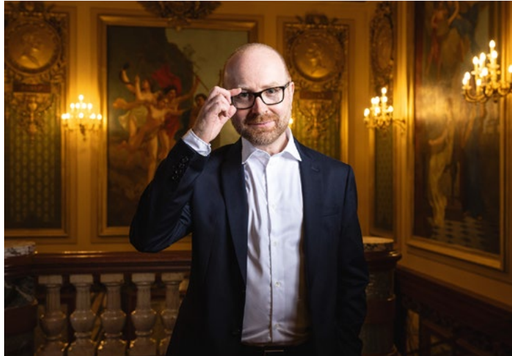
Alain Perroux

von Alain Perroux Intendant des Grand Théâtre de Genève