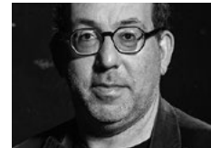
Barrie Kosky Regie Die Dreigroschenoper