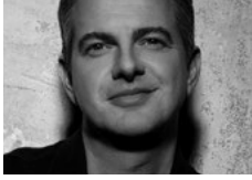
Philippe Jaroussky Countertenor Only The Sound Remains