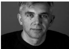
Laurent Pelly Regie und Kostüme Il viaggio a Reims