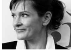
Netia Jones Regie, Bühnenbild und Kostüme La Tempête