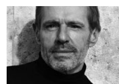
Lambert Wilson Bariton Candide