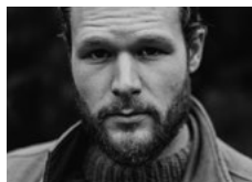
Philippe Sly Bassbariton Le nozze di Figaro