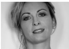
Natalie Dessay Sopran Candide