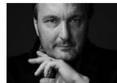
Ludovic Tézier Bariton Recital