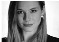
Lauranne Oliva Sopran Le nozze di Figaro