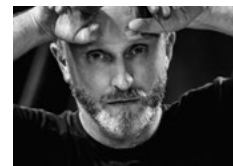
Damien Jalet Choreografie Brise-lames