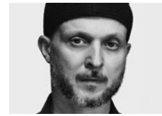
Sidi Larbi Cherkaoui Choreografie Dimokratia