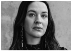
Lise Davidsen Sopran Recital