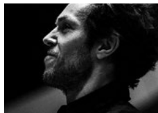
Raphaël Pichon Musikalische Leitung Theodora