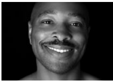
Kyle Abraham Choreografie River Without Banks