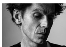
Krzysztof Warlikowski Regie Theodora