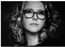
Jetske Mijnsen Regie Le nozze di Figaro