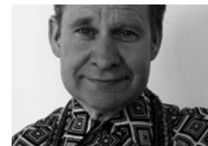
Peter Sellars Regie Only the Sound Remains